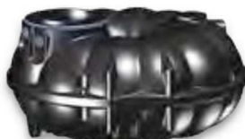
NEO 3.000 Liter