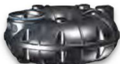
NEO 1.500 Liter