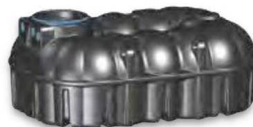
NEO 7.100 Liter