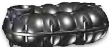
NEO 5.000 Liter