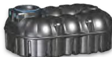
NEO 7.100 Liter